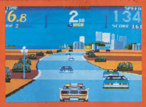
Image Works, Irwin House, 118 Southwark Street, London SE1 0SW. Tel: 071-928 1454. Fax: 071-583 3494

© 1991 Jaleco Ltd. Cisco Heat™ is a trademark of Jaleco Ltd Japan. This game has been manufactured under licence from Jaleco Ltd Japan. © 1991 Mirrosoft Ltd. Image Works is a brand name of Mirrosoft Ltd.