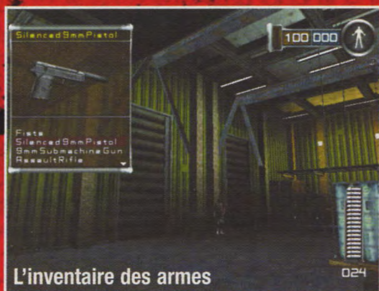
L'inventaire des armes

Pour choisir une autre arme dans votre inventaire, appuyez sur droite de la manette + pour accéder à l'inventaire des armes ; prenez l'arme suivante en appuyant sur haut de la manette + ou l'arme précédente en appuyant sur bas de la manette +. Appuyez sur le Bouton A pour prendre en main l'arme sélectionnée.