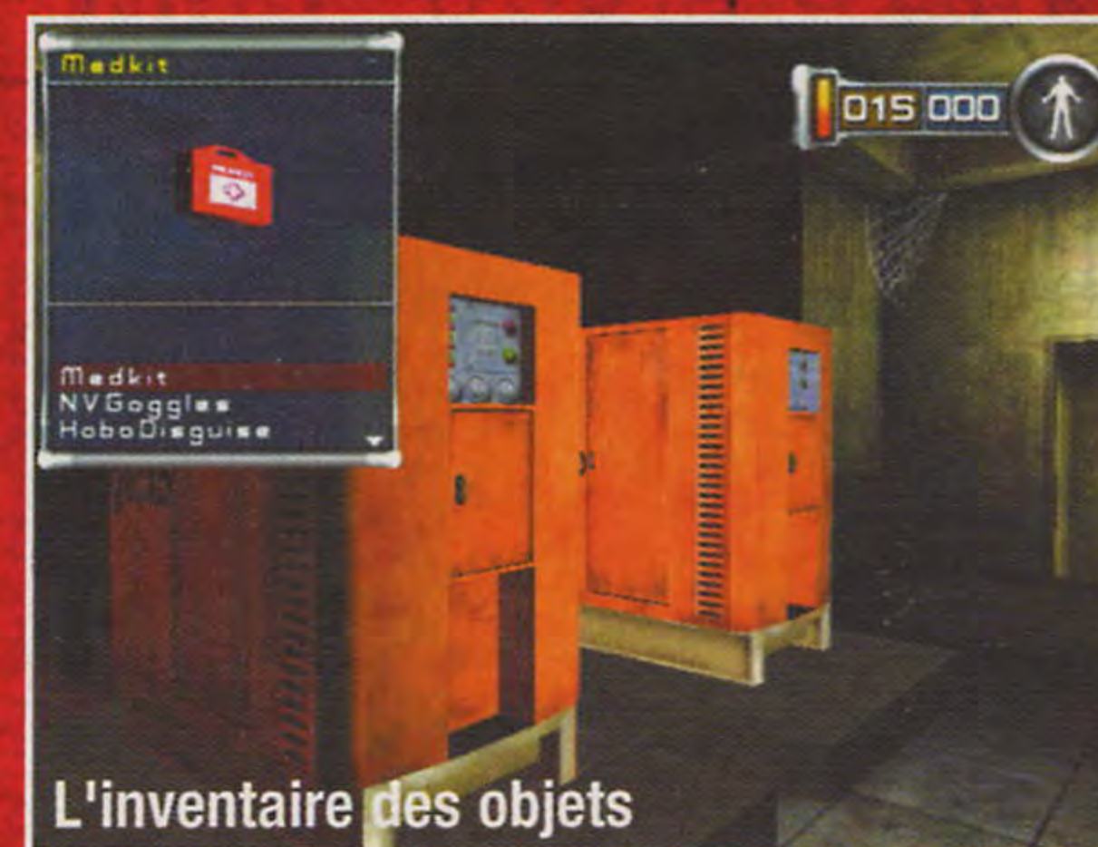
L'inventaire des objets

Pour utiliser des objets dans l'inventaire, appuyez sur gauche de la manette +, puis passez les objets en revue à l'aide de haut et bas de la manette + pour choisir l'objet à utiliser. Lorsque l'objet voulu est affiché, appuyez sur Bouton A pour l'utiliser.