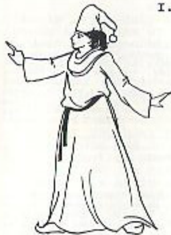
Bebo Magician Apprentice

At the top of Mount Althus lies an ancient, brooding castle, the Castle of Deceit. It served as a gateway to six other universes and dimensions. At the center of the castle rests six magical stones, the Runes of Guarding. The Runes were guarded by Phylax, a mystic Emerald Magic. He dwelled within the energies created by interaction of the stones century after century until at last it drove him insane. The power of the stones gave life to the hallucinations of his madness, thus creating six deadly beings which stole the runes and fled to the six universes.