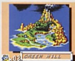
エリアマップ画面