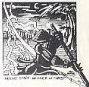
DEADLY STAFF WELTER IN FOREST