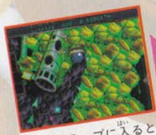
ループトラップに入ると…

ソニックがループトラップをくり返し回っていると、ループボーナスがもらえます。ループボーナスが出るとゲーム中ファンファーレが鳴ります。