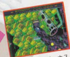
何回か回るとボーナス