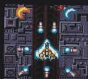
レベル3 ぜん こん かく 後ろ 2方向 + 左右