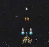
レベル1 まえ 後ろ 2方向