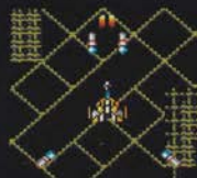
レベル2 ぜん こん かく 後ろ 2方向