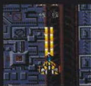
レベル2 まえ ほん 前2本