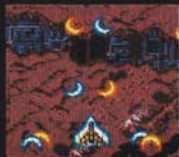
レベル2 まえ ほうこう 前4方向