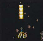
レベル3 ふと ほん 太1本