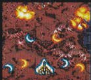
レベル3 まえ ほうこう 前4方向ワイド